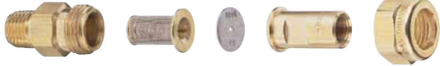
Корпус CP1322 1/4TT